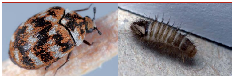
Figura 10. Adulto y larva de desméstidos

Otro orden de insectos cuyos integrantes son sumamente peligrosos para el patrimonio documental son las termitas u hormigas blancas (orden Isoptera) (figuras 11 y 12), las que se pueden clasificar en aquellas de madera húmeda y de madera seca. Estos son insectos sociales, habituales habitantes de bibliotecas de regiones cálidas y húmedas, los cuales, además de producir galerías muy profundas en la cara interna de las tapas, atacan la madera, el cuero, el pergamino de bibliotecas y otras construcciones.