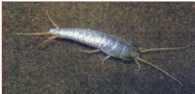
Figura 16. Adulto de pescadito de plata

Los pececillos de plata (orden Zygentoma) se caracterizan por poseer el cuerpo aplanado, recubierto por escamas plateadas, aguzado en el extremo terminado en tres largos filamentos (figura 16). Requieren de alta temperatura y humedad para su desarrollo. Estas condiciones las encontrarán en bibliotecas, archivos y depósitos, por lo cual se convierten en sus más frecuentes habitantes. Valiéndose de su cuerpo fusiforme, se abrirán fácilmente camino entre las hojas de los libros, raspando y desgastando la superficie del papel, suprimiendo parcial o totalmente lo impreso y, sólo en ocasiones, dejarán agujeros irregulares en la superficie (figuras 17 y 18). Se alimentan del pegamento utilizado para encuadernar libros o del moho que invade estos recintos. Asimismo, pueden provocar afectaciones a soportes especiales como son fotografías, mapas y planos.