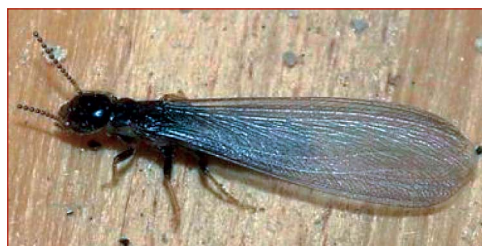
Figura 11. Termitas Reina