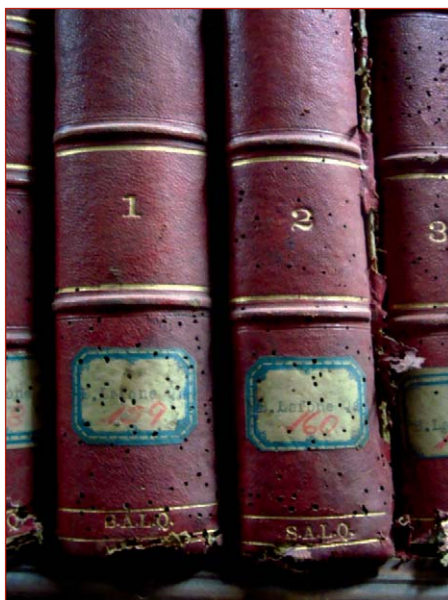
Figura 4. Orificios de salidas de los adultos de anóbidos