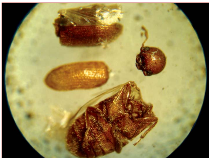
Figura 6. Restos del cuerpo de Stegobium paniceum observados bajo microscopio estereoscópico