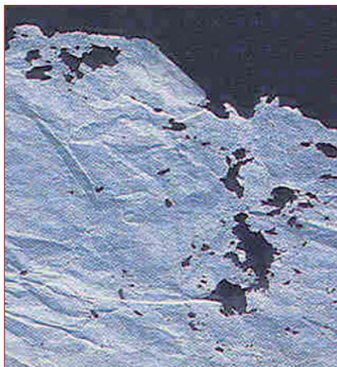
Figura 18. Detalle del daño producido por pescaditos de plata en el Archivo Nacional de Cuba