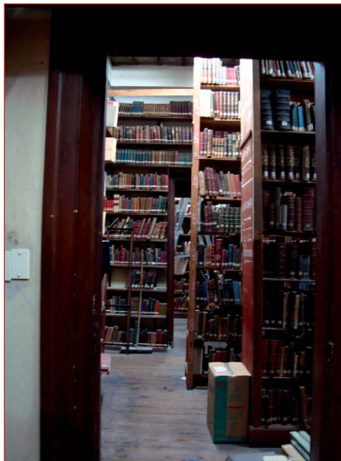
Figura 1. Vista del depósito de la Biblioteca del Museo

“Del relevamiento realizado en ambas instituciones se han observado dos tipos fundamentales de daño: el provocado por aquellos insectos que cavan galerías y el de los que dañan la superficie del papel. En ambos casos, se alimentan del almidón proveniente de los productos empleados en la encuadernación o de los mohos que proliferan en los libros”.