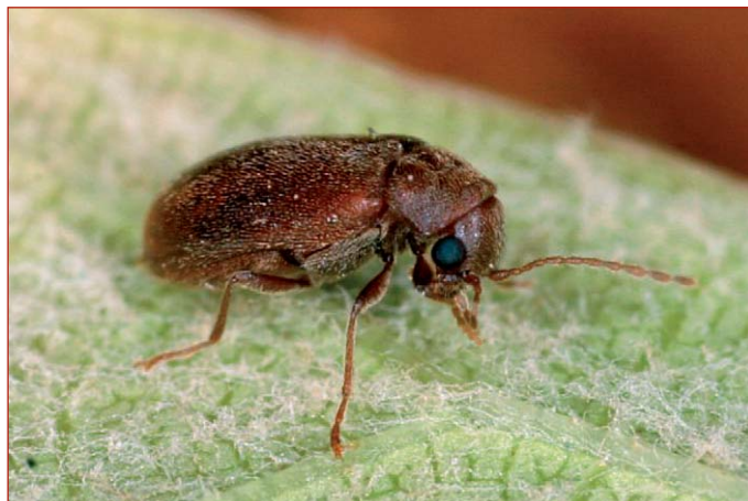
Figura 8. Adultos de Lasioderma serricorne “carcoma del pan” y “cucaracho del tabaco”

Aunque menos frecuentes que los anóbidos, en la biblioteca se observaron exuvias de larvas de otros coleópteros, pertenecientes a la familia Dermestidae (figura 9). Más pequeños que los anóbidos, los adultos poseen el cuerpo cubierto por escamas que se disponen imbricadas como las tejas de un techo, que les otorga un aspecto aterciopelado. Los adultos viven pocos días, alimentándose de polen y asegurando la puesta de numerosos huevos de los que nacerán pequeñas larvas. Fácilmente reconocibles por los abundantes mechones de pelos que cubren su cuerpo, las larvas (figura 10) se alimentan de todo producto que contenga proteínas: cuero seco, lana, harinas, huesos, sangre seca. Prefieren lugares oscuros para alimentarse, por lo que son verdaderos especialistas en consumir el cuero de las encuadernaciones. Asimismo, constituyen serios riesgos para las colecciones de insectos depositados en cajas entomológicas u otras, como plumas de aves, cueros y pieles de animales embalsamados, alfombras y objetos que contengan lana en su composición.