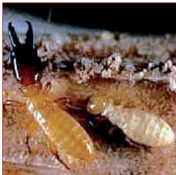
Figura 12. Soldado mandibulado y obrera