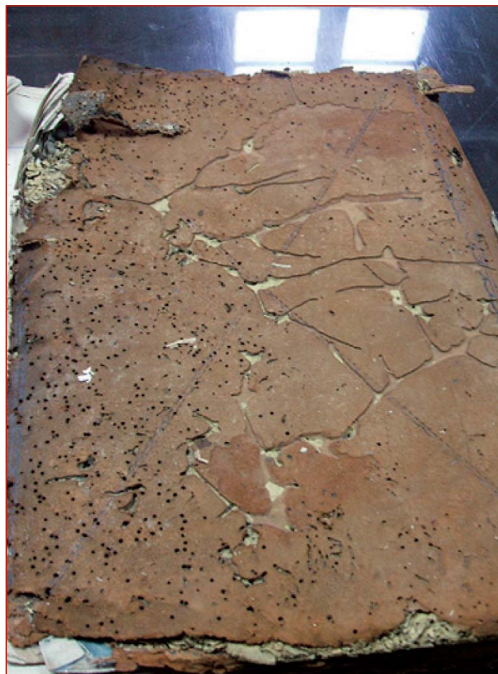
Figura 5. Orificios de salidas de los adultos de anóbidos