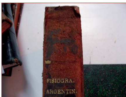
Figura 15. Daño producido por cucarachas en volúmenes de las salas de depósito de la biblioteca del Museo de La Plata