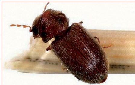
Figura 9. Adultos de Lasioderma serricorne “carcoma del pan” y “cucaracho del tabaco”