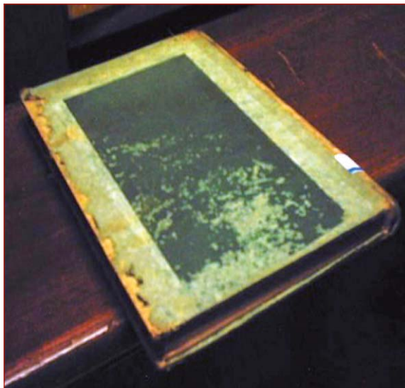
Figura 17. Detalle del daño producido por pescaditos de plata en el Archivo Nacional de Cuba