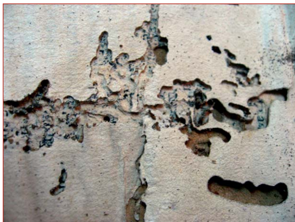
Figura 13. Daño producido por termites en un libro de las salas de depósito del Museo de La Plata

En las salas de depósito de la biblioteca del museo, se halló un antiguo ejemplar con una afectación severa de termites. En este volumen, se observan galerías regulares sin residuos, así como galerías irregulares (figura 13). Probablemente, esta plaga proviene del sitio anterior donde se hallaba depositado el ejemplar, ya que no se observó evidencia de termites en otros ejemplares cercanos ni en el edificio del museo en sí (ventanas, estanterías). Por el contrario, en el Archivo Nacional de Cuba, sí se detectaron heces de termitas de madera húmeda en algunos ventanales de madera, pero no en los documentos revisados.