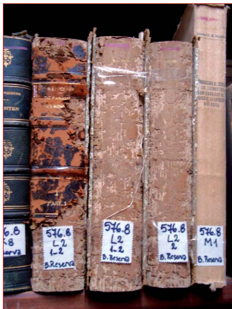
Figura 2. Galerías realizadas por anóbidos en las salas de depósito de la Biblioteca del Museo de La Plata

En la biblioteca del museo, se localizaron numerosos volúmenes que poseen sus cubiertas de cuero con diferente grado de deterioro (figuras 2 y 3), así como numerosos orificios realizados por los adultos al emerger (figuras 4 y 5) y polvillo fino en la cara interna de las tapas que corresponde a excrementos y material eliminado a medida que avanzan las larvas cavando las galerías. Asimismo, se detectó la presencia de una larva viva en una de dichas galerías. Al analizar con microscopio estereoscópico varios volúmenes, se identificaron diferentes partes del cuerpo correspondientes a insectos (figura 6); estos fueron identificados como Stegobium paniceum (Linneo) “carcoma del pan” (figura7), Anóbido.