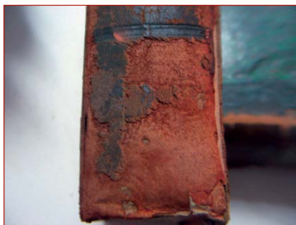
Figura 14. Daño producido por cucarachas en volúmenes de las salas de depósito de la biblioteca del Museo de La Plata

Con respecto a los insectos que dañan la superficie de los libros y demás patrimonio documental se hallan las cucarachas, los pececillos de plata y los piojos de los libros, que consumen papel, elementos para encuadernar y los hongos que habitan entre los libros. Las cucarachas (orden Blattaria) se han adaptado a vivir con mucho éxito en rincones, lugares protegidos y oscuros desde donde pueden acceder a una gran variedad de alimentos. Con sus fuertes mandíbulas, muerden las portadas de los libros, las cuales desgastan dejando la superficie arrugada. Prefieren el papel glaseado o coloreado y dejan áreas desgastadas irregulares (figuras 14 y 15). Sus heces afectan desde el punto de vista estético las publicaciones y estanterías. Además, la presencia de este grupo de insectos es perjudicial para el personal que manipula los documentos por las enfermedades que pueden transmitir.