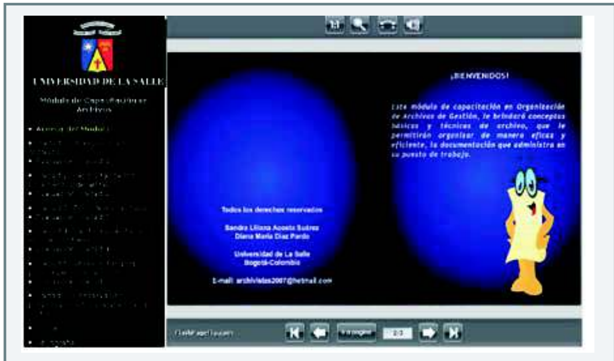
GRÁFICA 3. VISTA GENERAL DEL MÓDULO DE CAPACITACIÓN EN ORGANIZACIÓN DE ARCHIVOS DE GESTIÓN