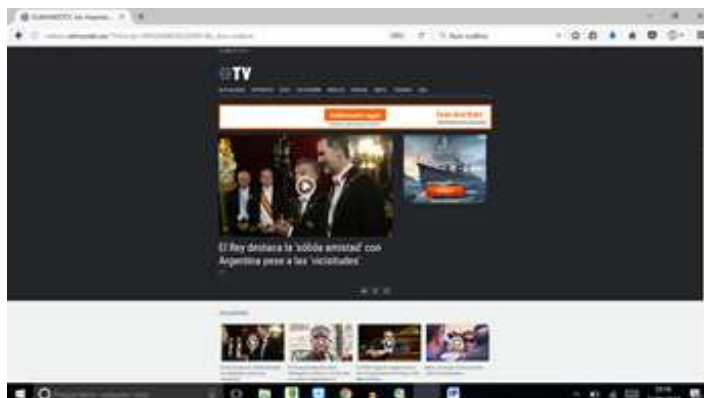
Imagen 13. Periódico El Mundo. Repositorio de vídeos

Este periódico, al igual que el anterior, cuenta con una sección especializada en audiovisual. Algo más complicado de acceso, al no contar con un enlace desde la página principal, cuenta con un repositorio –no buscador– en el cual se bucea por medio de una clasificación temática. Los vídeos son mostrados atendiendo a parámetros cronológicos (imagen 13).