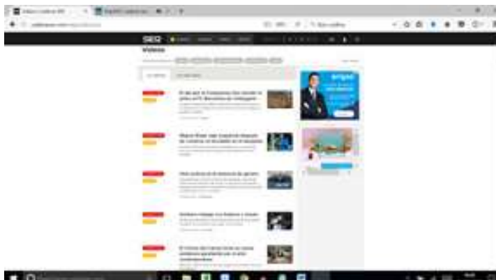
Imagen 3. Cadena Ser. Repositorio/Buscador de vídeos

En último lugar indicar que desde la Cadena Ser se potencia el acceso a recursos audiovisuales (como forma de fidelización de ciberespectadores) por medio de su propio canal en Youtube.