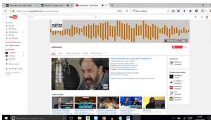
Imagen 4. Cadena en Youtube de la Cadena Ser

A continuación analizamos la Cadena Cope, cadena perteneciente a la Conferencia Episcopal de España. Cuenta con una estructura muy similar a la aportada a la desarrollada por la Cadena Ser. Su portada (imagen 5 y 6) tienen la misma estructura que el anterior recurso analizado, pareciéndose a un periódico web, salvo por que nos facilita la opción de acceder a audios y a vídeos (imagen 6). Tiene un menor número de noticias con desarrollo textual, al igual que aparecen menos cantidad de documentos de naturaleza audiovisual.