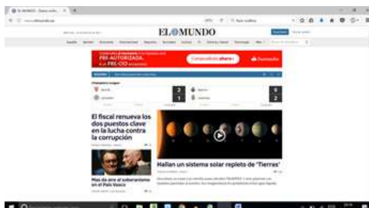
Imagen 12. Periódico El Mundo. http://www.elmundo.es

El periódico El Mundo (imagen 12 y 13) es el periódico Líder en su difusión en línea. Es una cabecer veterana que está desarrollando grandes esfuerzos por convertirse a los nuevos lectores. No obstante, analizando su primera página, y otras relacionadas, se observa la presencia de recursos audiovisuales, además de recursos fotoperiódicos y evidentemente información de carácter textual. Los recursos audiovisuales son cuantitativamente muy inferior al periódico analizado con anterioridad, aunque sí que es evidente la presencia de información audiovisual en el mismo (imagen 12).